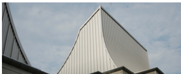
Ny formgivning af miljøteknologi ved staldanlæg

I forbindelse med projektets udforskning af storlandbrug i industriområder vil der blive undersøgt, hvorvidt jordløse produktionsanlæg har potentiale til at reaktivere de funktionstømte industri kvarterer og tilføre områderne ny æstetisk kvalitet og arkitektonisk udvikling.