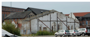
Industri kvarter i forfald

Det primære udgangspunkt er den aktuelle situation i de større byers periferi, hvor der ses en stigende tendens til at industri kvarterer funktionstømmes og langsomt går i forfald.